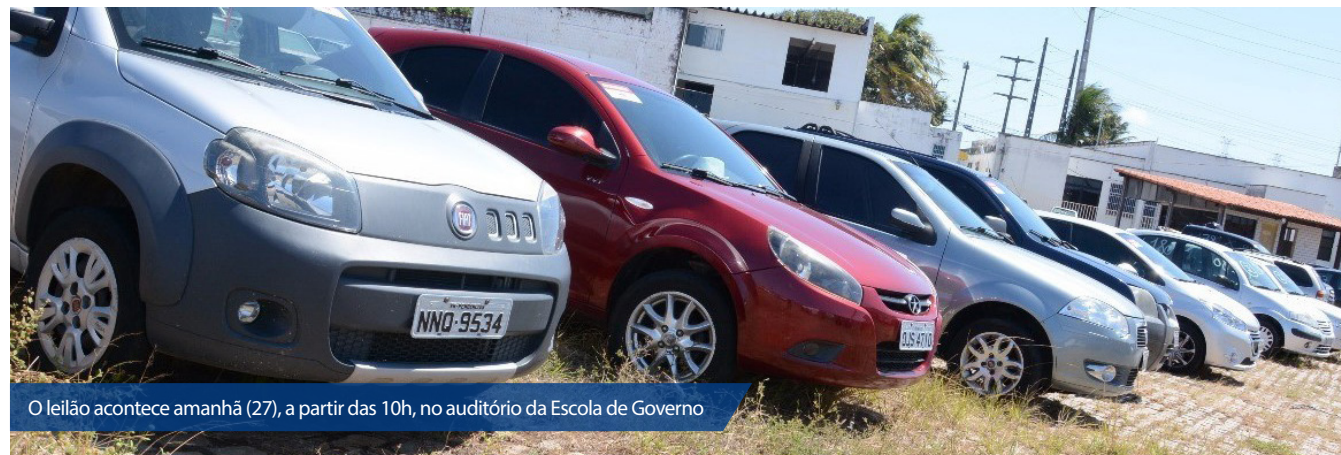
O leilão acontece amanhã (27), a partir das 10h, no auditório da Escola de Governo

O Governo do Estado, por meio do Departamento Estadual de Trânsito do RN (Detran), abre, até hoje (26), o pátio de veículos apreendidos que vão ser leiloados amanhã (27). Os interessados em arrematar algum dos 277 lotes podem visitar das 8h às 14h o pátio situado no antigo galpão da Viação Guanabara, na Rua Bom Pastor, 1222, bairro das Quintas, em Natal. A relação compreende veículos que devem permanecer em circulação, além de outros destinados exclusivamente à sucata.