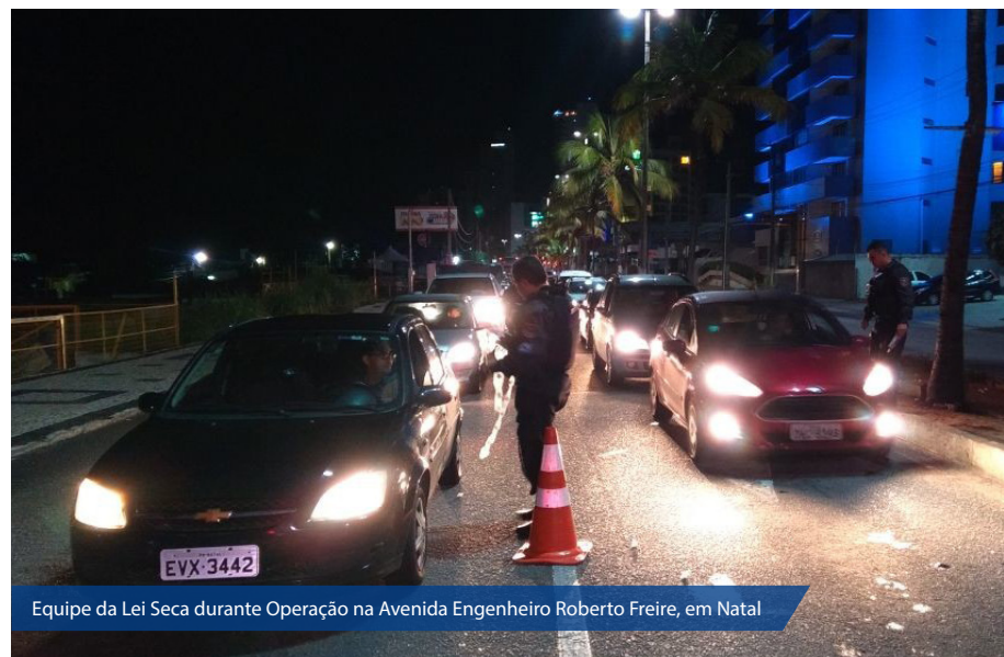
Equipe da Lei Seca durante Operação na Avenida Engenheiro Roberto Freire, em Natal

O motorista flagrado dirigindo embriagado é punido com retenção da CNH, apreensão do veículo, que só será liberado com a presença de um condutor habilitado, multa no valor de R$2.934,70 e sete pontos na carteira, além de outras penalidades administrativas (artigo 165 CTB). Isso se o teste de