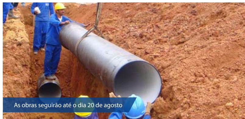
As obras seguirão até o dia 20 de agosto

Até 20 de agosto, as obras também devem ser retomadas nos bairros Pitimbu e Planalto, que estão com a rede praticamente concluída.