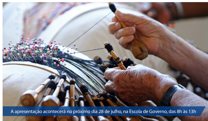
A apresentação acontecerá no próximo dia 28 de julho, na Escola de Governo, das 8h às 13h